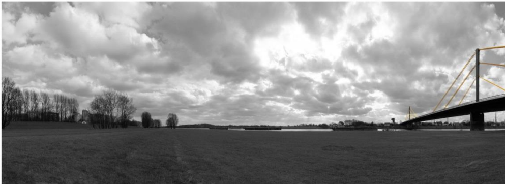
Halde Rheinpreußen P6 sw/rot