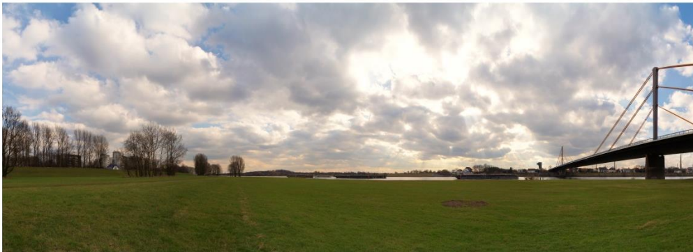
Halde Rheinpreußen P6